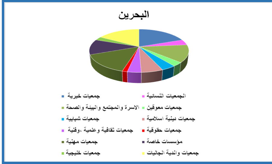
الشكل رقم (2): تصنيف الجمعيات الأهلية في مملكة البحرين